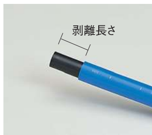
【表3】外層カバー剥離部分長さ